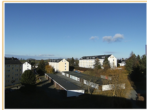
Blick auf die Wohnanlage "Windmühlenweg"