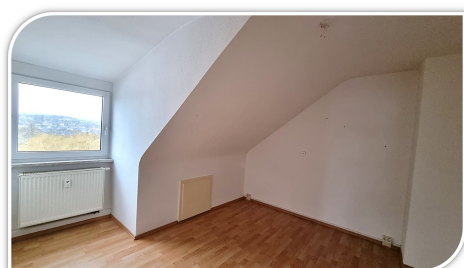
Schlafzimmer mit Ausblick