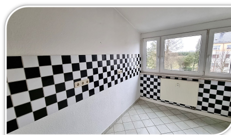
Küche mit Fliesenspiegel