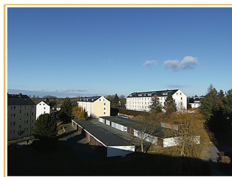
Blick auf die Wohnanlage "Windmühlenweg"